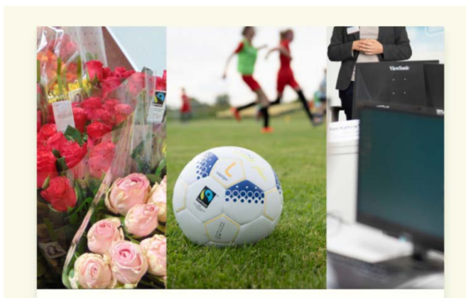
Abbildung 4

In Taucha engagieren sich seit einigen Monaten Mitglieder der ökumenischen Nachhaltigkeitsinitiative Taucha (ÖNIT) dafür, dass sich Taucha der Initiative „ Fairtrade Town “ anschließt. Fairtrade-Towns fördern den fairen Handel auf kommunaler Ebene und vernetzen Akteur*innen aus Zivilgesellschaft, Politik und Wirtschaft, die sich gemeinsam lokal für den fairen Handel stark machen. Für den Titel Fairtrade-Town muss eine Kommune nachweislich fünf Kriterien erfüllen: hier gehts zu den fünf Kriterien .