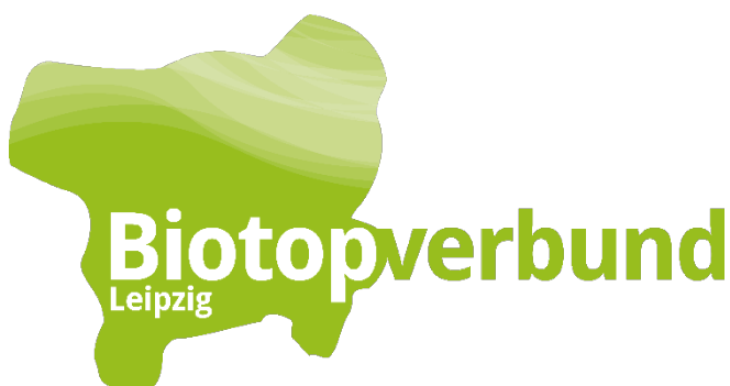
Abbildung 7

Auf Initiative des Biotopverbundes Leipzig (BVL) haben Ende März 30 freiwillige Helfer*innen eine Hecke an einem Feldrain an der Alten Schäferei in Thekla/Plaußig gepflanzt. Nach dem der Feldrand auf 150m Länge von Landwirten der Saat-Gut Plaußig Voges KG vorbereitet worden war, kamen insgesamt 305 Büsche aus 13 verschiedenen heimischen Gehölzarten in den Boden. Nun heißt es für Vögel und Insekten „Ab in die Hecke“.