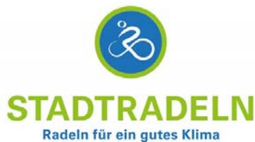
Abbildung 3:

Taucha nimmt in diesem Jahr erstmals am Stadtradeln teil. Die Aktion läuft vom 2. bis 22. Juni. In dieser Zeit sollen möglichst viele Radkilometer zurückgelegt und gezählt werden. Dabei geht es zunächst um den Spaß am Fahrradfahren und darum, möglichst viele Menschen zu motivieren, im Alltag häufiger vom Auto aufs klimafreundliche Rad umzusteigen. Das tut der Umwelt und unserer Gesundheit gut. Der Radverkehr rückt in diesen drei Wochen in den Fokus, was darüber hinaus die Position der Radfahrenden stärken soll.