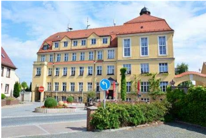
Abbildung 2: