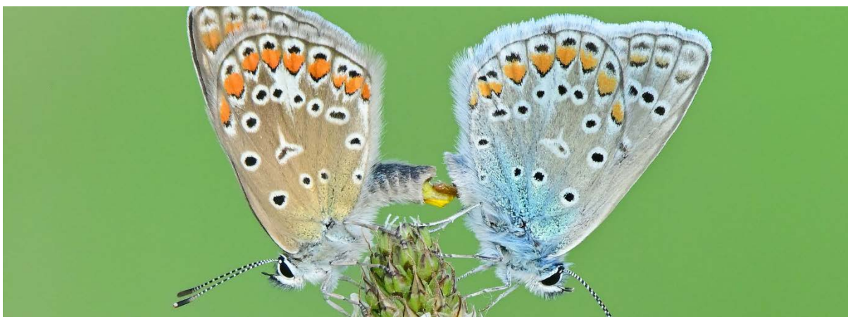
Abbildung 5