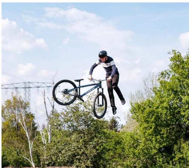
Abbildung 4

Zum Abschluss erleben wir auf dem Markt eine Show der Mimo-Trails, der Extremsportler aus Taucha auf dem Rad. Für Getränke und ein kleines Speiseangebot wird gesorgt.