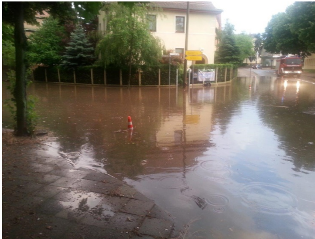
Abbildung 2