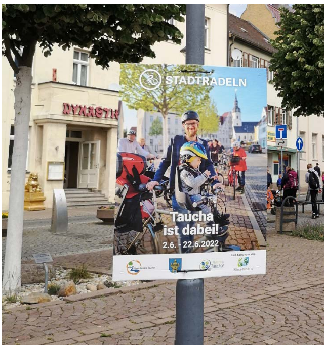
Abbildung 3

Die Werbung läuft und vier Tage vor Beginn der dreiwöchigen Radfahraktion haben sich 29 Teams und insgesamt 169 Radelnde in Taucha registriert. Das ist hoch erfreulich und motiviert, vielleicht die 200 zu erreichen.