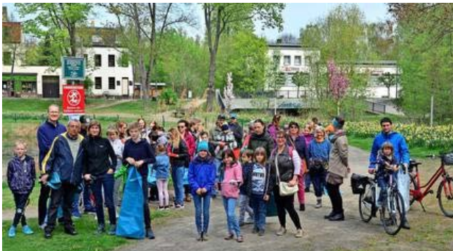
Abbildung 1

Danke an alle die, die am 30. April in Taucha Müll gesammelt haben. Etwa 80 Helfer*innen waren eifrig dabei, rund um den Schöppenteich und auch anderen Stellen die Stadt zu säubern.