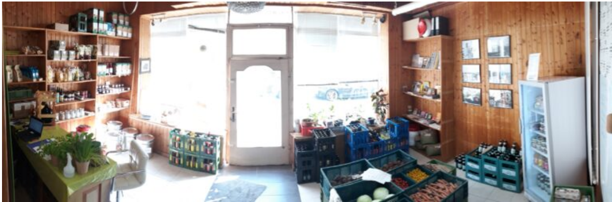
Abbildung 5

Das Organisationsteam für den in der Leipziger Straße 12 geplanten Regionalladen hat sein Konzept öffentlich vorgestellt. Am Tag des Frühjahrspulzes und während des Stadtfestes am letzten Mai-Wochenende warb Sylvia Kabelitz für das Vorhaben und um Unterstützung. Der Allmende Taucha e.V. hatte im September 2021 eine Aktionswoche für regionale Lebensmittel gestartet. Nun soll daraus ein dauerhafter Laden werden. Der Regionalladen will künftig Produkte aus Nordsachsen möglichst verpackungsfreundlich oder verpackungsarm anbieten. Zudem soll er ein Treffpunkt für die Nachbarschaft werden und zur Belebung der Tauchaer Innenstadt beitragen.