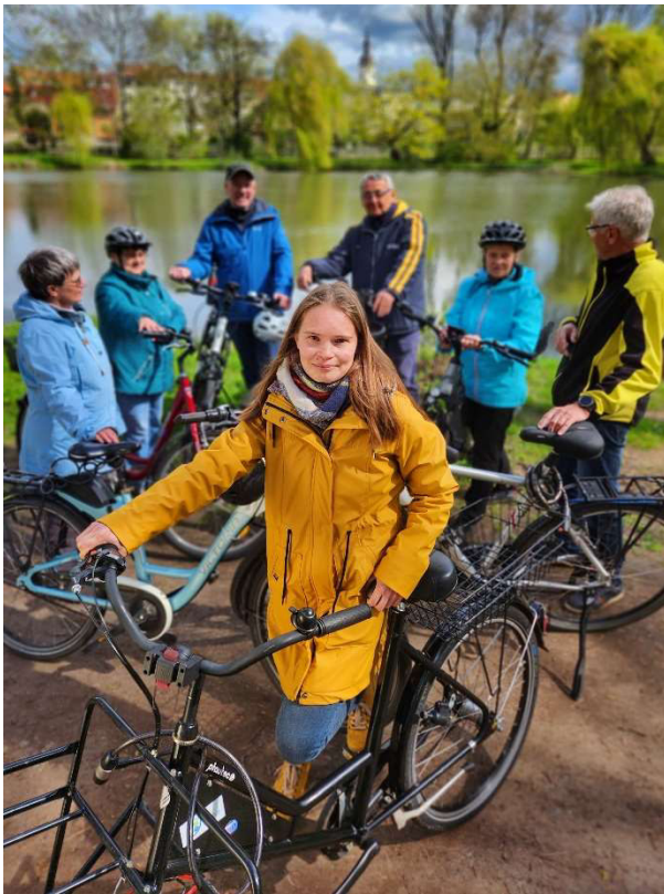
Abbildung 1: Das Team Zeit-Tausch-Börse fährt mit.

+++ 1. – 21. Juni STADTRADELN – Wir sind wieder dabei +++