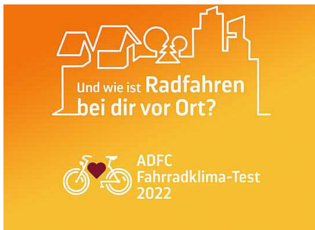
Abbildung 2: ADFC Logo Klima-Test

Die Tauchaer*innen sind mit dem Radverkehr in ihrer Stadt nach wie vor unzufrieden. Sie bewerten diesen Verkehrsbereich mit der Schulnote 4. Das ergab der ADFC Fahrrad-Klima-Test 2022, dessen Ergebnisse am 24. April veröffentlicht wurden. 166 Bürger*innen haben in Taucha teilgenommen, fast genauso viele wie vor zwei Jahren.