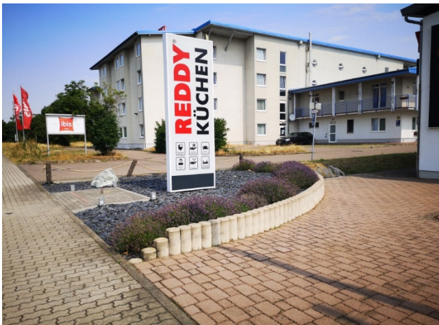
Abbildung 3: An der Otto-Schmidt-Straße. Versiegelte Flächen und ein Schotter"garten".

Hitzeschutz ist eine komplexe Aufgabe, die z.B. Städteplanung unter Beachtung von Frischluft-Schneisen, das Bauen und Wohnen sowie die Gesunderhaltung und die Risikobetreuung alter Menschen betrifft.