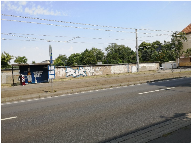
Abbildung 2: Straßenbahnhaltestelle an der Leipziger Straße. Nirgends Schatten, vertrockneter Grünstreifen.

Es wird im Sommer heißer und diese Hitzeperioden halten länger an. Wiesen und Felder vertrocknen, der Grundwasserspiegel fällt und Feld- und Waldbrände werden häufiger. In den Medien ist jetzt oft von kommunalen Hitzeschutzplänen die Rede. Einige Städte haben solche Pläne bereits oder arbeiten daran (z.B. auch Leipzig) Taucha hat noch keinen Plan, wird sich aber mit dem Thema befassen müssen.