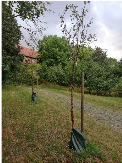
Abbildung 5: Streuobstwiese am Schloss.

Da die letzten beiden Monate sehr trocken und heiß waren, zeigen die jungen Bäume auf der Streuobstwiese hinter dem Schloss schon erste Trockenschäden. Heiko Thonig vom NABU in Taucha, der die Streuobstwiese betreut, rief deshalb vor zwei Wochen zu einer Gießaktion auf.