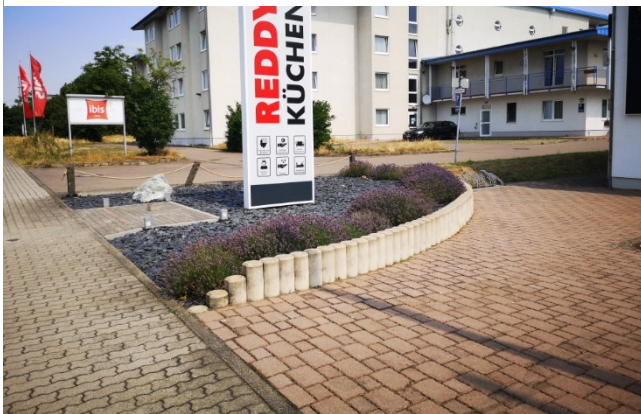
Abbildung 3: An der Otto-Schmidt-Straße. Versiegelte Flächen und ein Schotter“garten“.

Es wird im Sommer heißer und diese Hitzeperioden halten länger an. Wiesen und Felder vertrocknen, der Grundwasserspiegel fällt und Feld- und Waldbrände werden häufiger. In den Medien ist jetzt oft von kommunalen Hitzeschutzplänen die Rede. Einige Städte haben solche Pläne bereits oder arbeiten daran (z.B. auch Leipzig) Taucha hat noch keinen Plan, wird sich aber mit dem Thema befassen müssen.