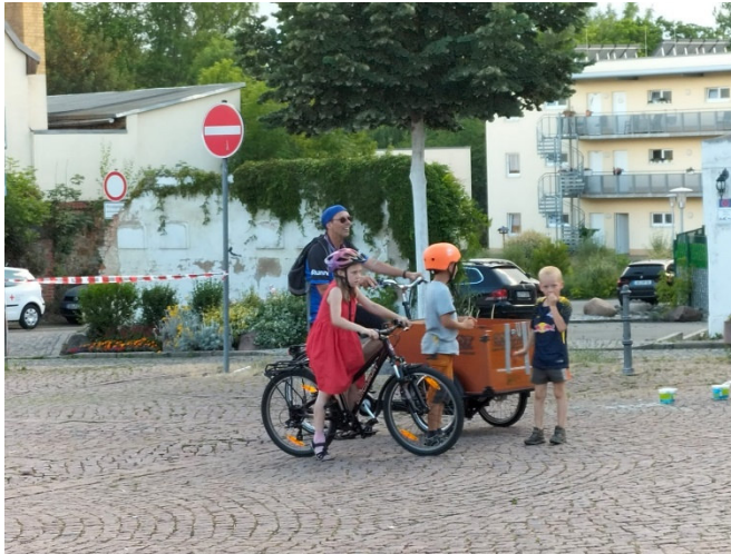
Abbildung 4: Sicherheit für alle Verkehrsteilnehmer*innen.

Nach der Verkehrsumfrage in Taucha im März und der Vorstellung der daraus resultierenden Ergebnisse im Juni soll die Diskussion in einem Workshop „Verkehr kommunal“ weitergeführt werden. Die Stadt lädt dazu am 23.09. 2023 ab 10 Uhr ins Rathaus ein.