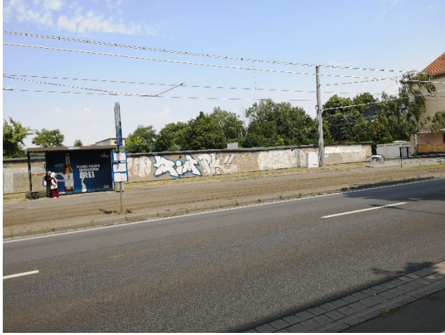
Abbildung 2: Straßenbahnhaltestelle an der Leipziger Straße. Nirgends Schatten, vertrockneter Grünstreifen.